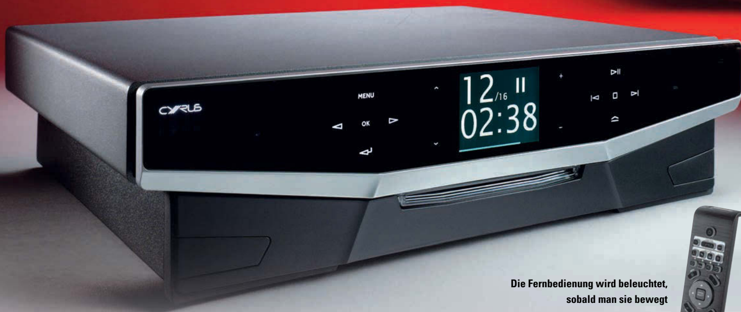
Die Fernbedienung wird beleuchtet, sobald man sie bewegt

Selten erregte eine Anlage derartiges Aufsehen und fand so viel begeisterte Zustimmung wie diese, mit der sich Cyrus eindrucksvoll zurückmeldet