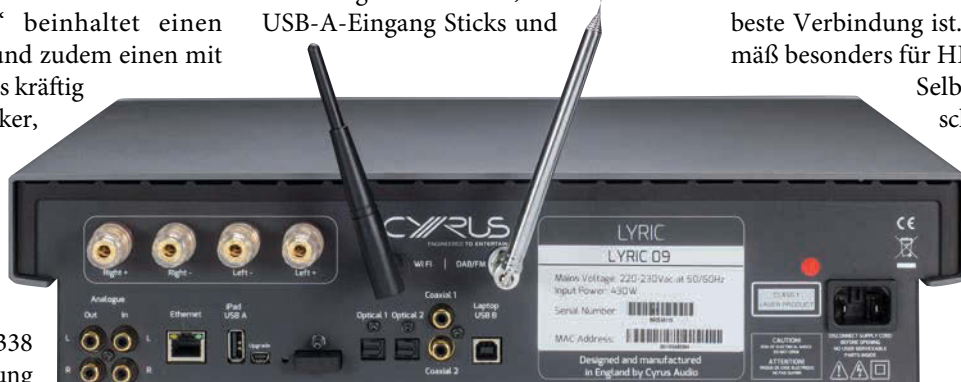
Alles drin, alles dran: Bluetooth/DAB+/UKW-Antennen, Analog In/Out, LAN, Digitaleingänge samt USB-A/B

Selbst die demografische Entwicklung hat